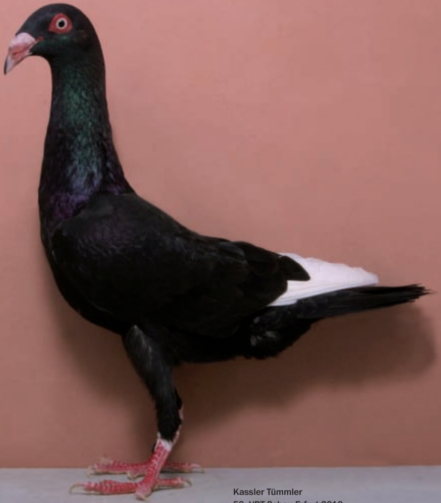
Kassler Tümmeler 59. VDT-Schau Erfurt 2010 sg 93 Züchter: Werner Kötter, Düsseldorf